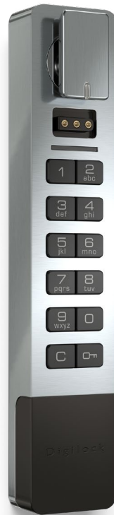
Aufbaumontage Griff oben