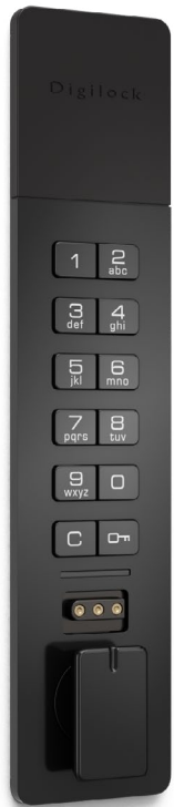
Einbaumontage Griff an der Unterseite

Wählen Sie zwischen verschiedene eleganten Gehäuseformen in den Ausführungen Edelstahl Finish und schwarz.