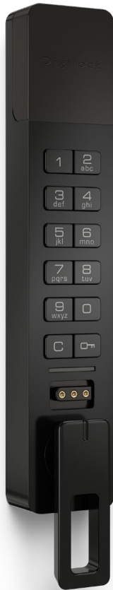
Aufbaumontage längerer ADA- Griff an der Unterseite